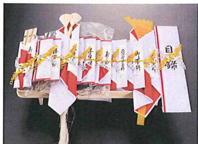
金彩九品 24,000円(税込) 風呂敷(四巾)筆耕付